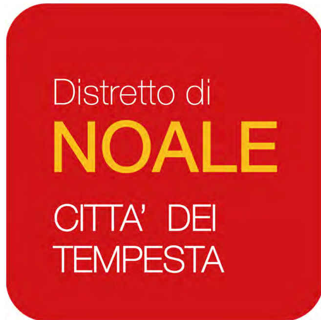
(Bozza di Logo del Distretto)

ambito territoriale nel quale i cittadini, le imprese e le formazioni sociali sono in grado di fare del commercio il fattore di integrazione e valorizzazione di tutte le risorse di cui dispone il territorio, per accrescere l'attività, rigenerare il tessuto urbano e sostenere la competitività delle sue polarità commerciali.